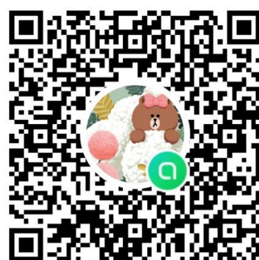
↑Line 社群 QR code 連結↑