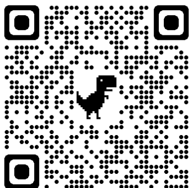
↑線上報名 QR code 連結↑